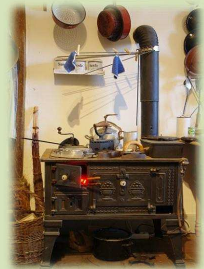
wenn sie der Mensch bewacht