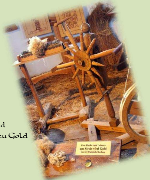
Hier wird Stroh zu Gold