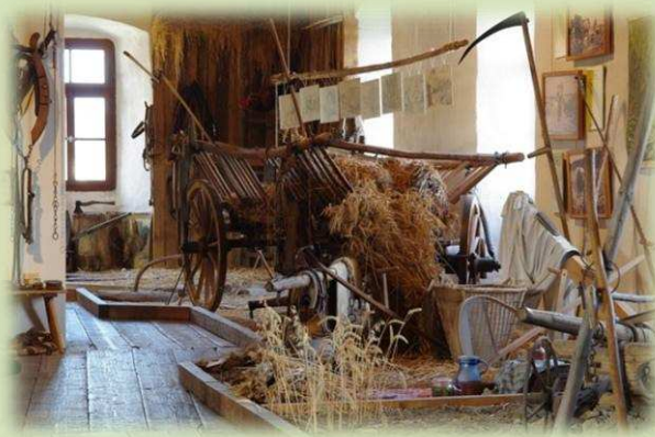
für unser täglich Brot