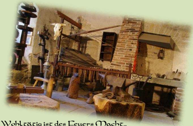
Wohlthätig ist des Feuers Macht...